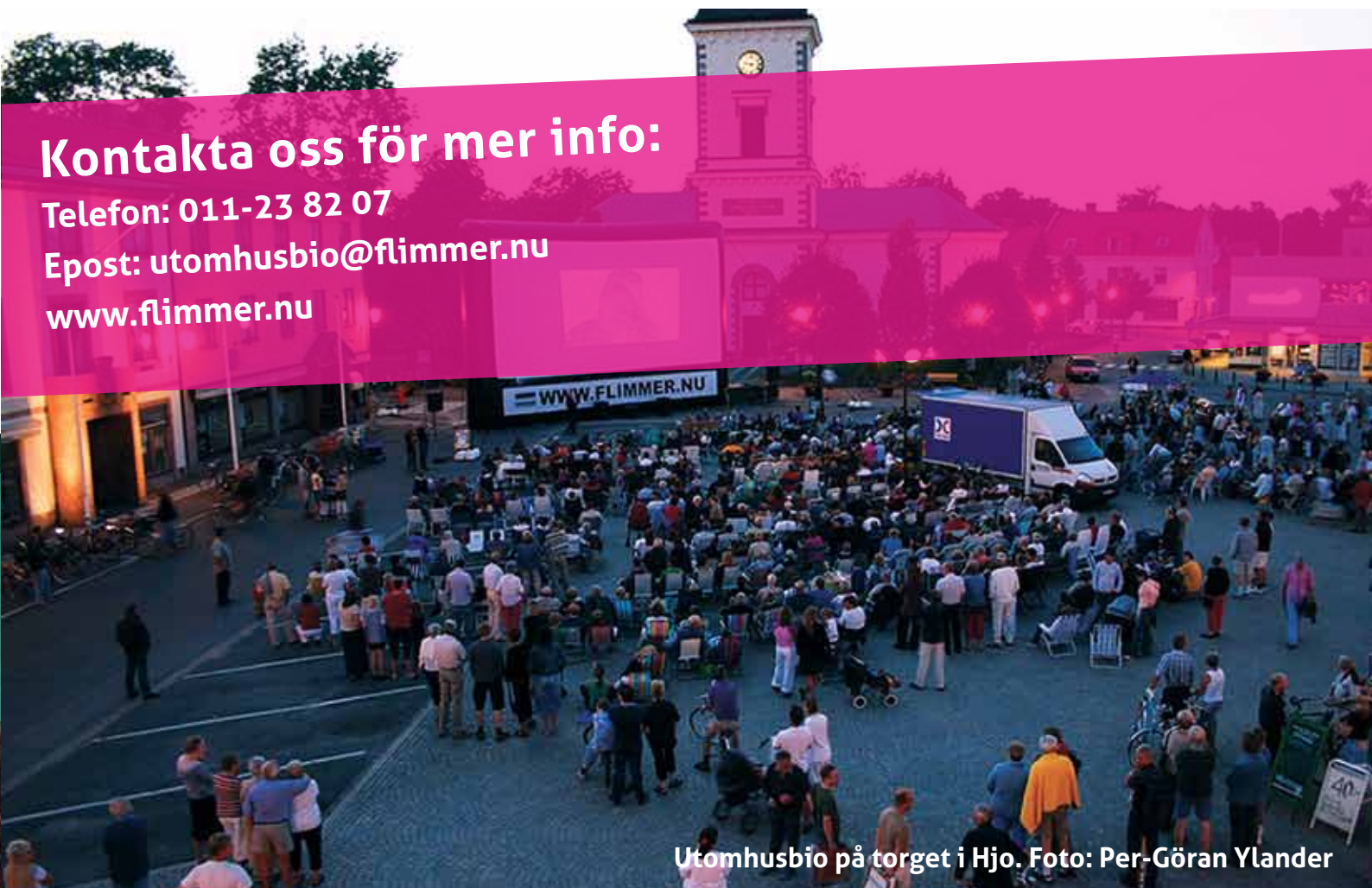
Utomhusbio på torget i Hjo.